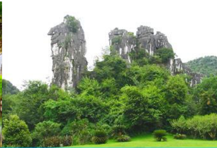
เขากูจู่