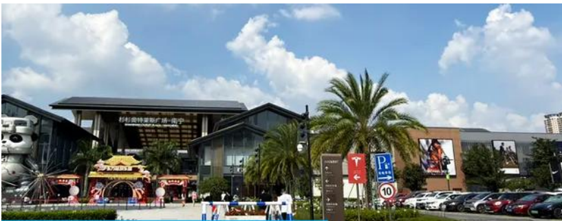
Shan Shan outlet