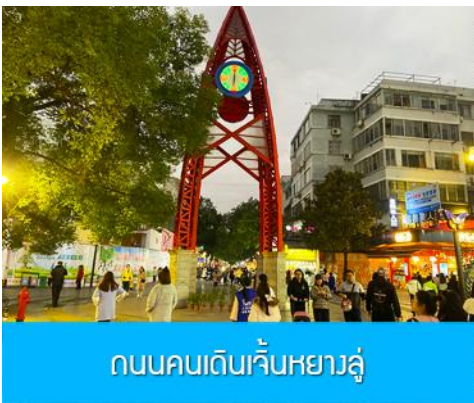
ถนนคนเดินเซ็นหยางลู