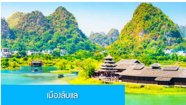
เมืองลับแล

เย็น อิสระอาหารค่ำเพื่อความสะดวกในการเดินเที่ยว และชมอาหารพื้นเมืองตามอัธยาศัย พักที่ YANGSHUO ELITE GARDEN HOTEL ระดับ 4 ดาวห้องถื่นหรือเทียบเท่าใน เมืองหยางชว่