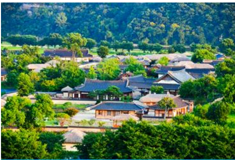
ศูนย์วัฒนธรรมเกาหลี

เช้า รับประทานอาหารเช้า ณ ห้องอาหารของโรงแรม (6)