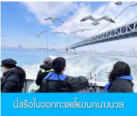
นั่งเรือใบออกทะเลลี้ยนกนางนวล

ต่อด้วยนำท่านเที่ยวชมถนนรัสเซีย 俄罗斯风情街 ในอดีตที่นี่เป็นศูนย์ที่ตั้งของที่ทำการเมืองต้าเหลียน ภายหลังได้กลายเป็นชุมชนของพ่อค้าและวิศวกรทางรถไฟชาวรัสเซีย บริเวณนี้จึงเต็มไปด้วยอาคารบ้านเรือนแบบตะวันตก(รัสเซีย) มากมาย นอกจากนี้ได้เก็บภาพที่มีพื้นหลังเป็นอาคารสถาปัตยกรรมตะวันตก ที่นี้ยังมีร้านค้าที่จำหน่ายสินค้าและของที่ระลึกที่นำเข้ามาจากรัสเซีย อาทิ ช็อคโกแลต เหล้าวอดก้า ตุ๊กตารัสเซีย ฯลฯ