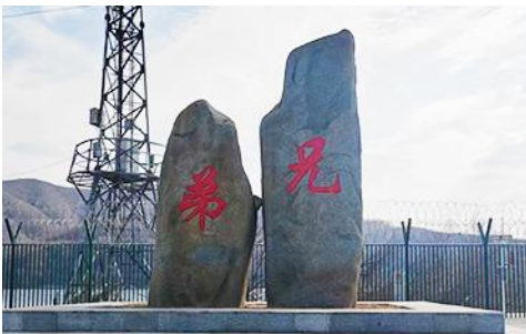
ป้ายพรมแดนจีนเกาหลีและแท่งศิลาสองพี่น้อง