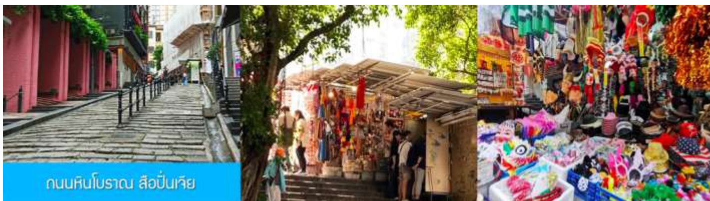
ถนนหินโบราณ สือปิ่นเจีย