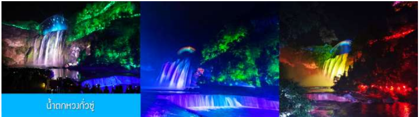
น้ำตกหวงกั๋วชู่

หลังอาหารนำท่านเดินทางโดยรถบัสสู่อุทยานน้ำตกหวงกั๋วชู่ (ใช้เวลาเดินทางราว 1 ชั่วโมง) เที่ยวชม น้ำตกหวงกั๋วชู่ 黄果树瀑布 แหล่งท่องเที่ยวขึ้นชื่อระดับ 5A ที่ถือเป็นสัญลักษณ์ของมณฑลกุ้ยโจว เป็นหมู่ น้ำตกที่ประกอบด้วยน้ำตกน้อยใหญ่กว่าสิบแห่ง โดยมีน้ำตกหวงกั๋วชู่เป็นน้ำตกขนาดใหญ่ที่มีความสูง 74 เมตร กว้าง 81 เมตร เป็นน้ำตกหลักของอุทยาน ชมความสวยงามของน้ำตกที่ประดับด้วยแสงสีและเลเซอร์ยามค่ำคืน ที่แต่งแต้มความมหัศจรรย์แก่อุทยานแห่งนี้ (ค่าทัวร์รวมค่ารถรับส่ง รวมค่าบันไดเลื่อนขาลง และขาขึ้นภายในอุทยาน)