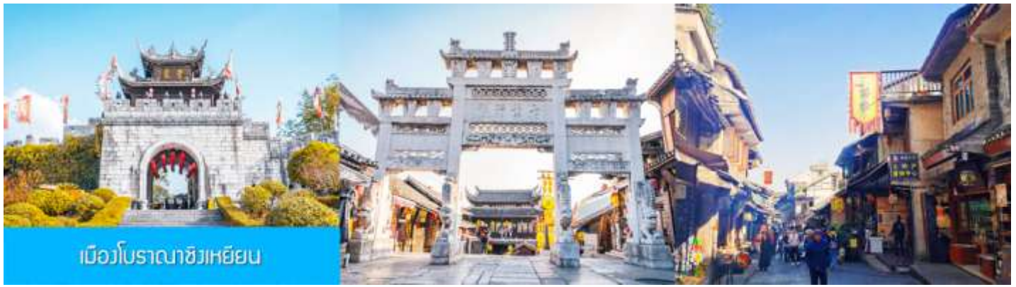
เมืองโบราณชิงเหียน