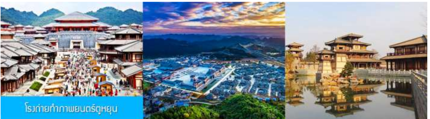
โรงถ่ายกำกภาพยนตร์อุทยาน

พักที่ HUANGGUOSHU FENGWEI HOTEL โรงแรมระดับ 4 ดาวท้องถิ่นใกล้อุทยานหวงกั๋วชู่