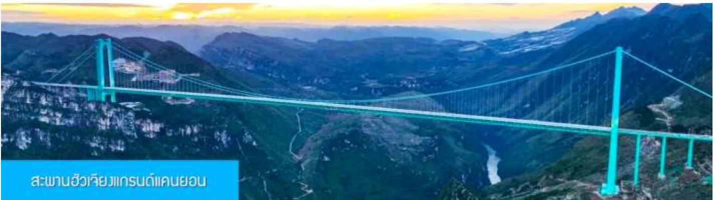
สะพานฮัวเจียงแกรนด์แคนยอน