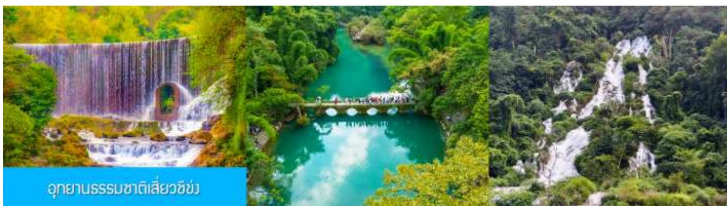
อุทยานธรรมชาติเสี่ยวชิ่ง

พักที่ DUSHAN HOLY VILLA RESORT โรงแรมระดับ 5 ดาวท้องถิ่น หรือเทียบเท่าในเมืองดูชาน