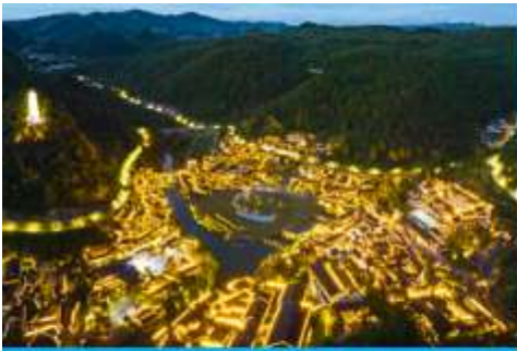
เมืองโบราณวูเจียงจ้าย