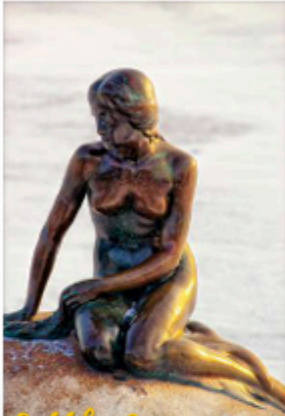
The Little Mermaid

รับประทานอาหารกลางวัน ณ RESTAURANT VITA (15) หรือเทียบเท่า