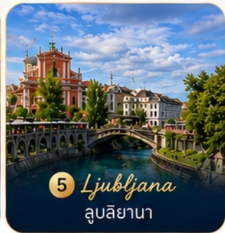
5 Ljubljana ลูบลียานา