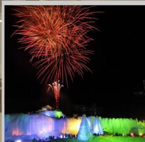
"SOUNKYO ICE FEST"