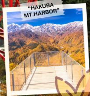
"HAKUBA MT. HARBOR"

วันเดินทาง 28 ต.ค. - 3 พ.ย. 2569 4 - 10, 11 - 17 พ.ย. 2569