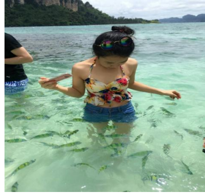
ชมทะเลแหวกUnseen in Thailand เชื่อมระหว่างเกาะทับ และเกาะหม้อ