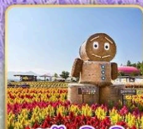
สวนซึกิไซโนะโอกะ