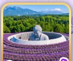
สวนซิกิโซโนะโอะกะ