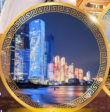
No.3 Bathing Beach

ลานจัดงานเบียร์ชิงเต่า Golden Beach ทางเดินไม้ริมทะเล ศาลเจ้าเทพทะเล ถนนคนเดินโตตง วัดไท่ซิงกง ซาโจโซ่ว พิพิธภัณฑ์ชิงเต่า ซิกแนลฮิลล์ ถนนหลงเจียง ลู่ ย่านหยินหยูเซียง ย่าน Da Bao island โบสถ์ st.Michael's Cathedral ถนนจงซาน ย่านป่าตึกวน จัตุรัสเมย์ไฟร์