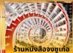
ร้านหนังสือจขุเก้อ