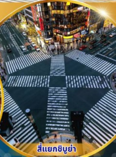
สี่แยกชิบูย่า