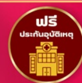
ฟรี ประกันอุบัติเหตุ