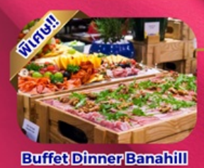
Buffet Dinner Banahill