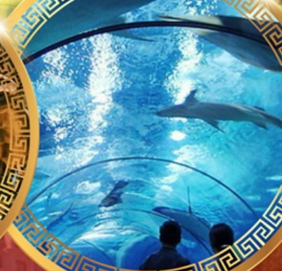
เซี่ยงไฮ้อาเซียนอะควาเรียม