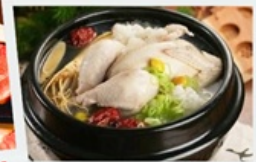
อาหารวังหลวงไก่ตุ๋นโสม