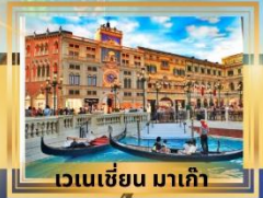
เวเนเซียน มาเก๊า