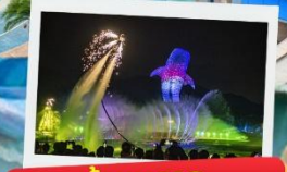
ห้ามพลาด ชมการแสดงพุทธรักษา