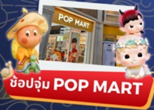
ช้อปปิ้ง POP MART