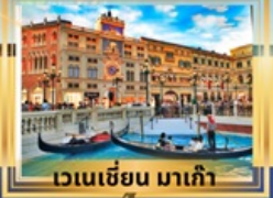
เวเนเซียน มาเก๊า