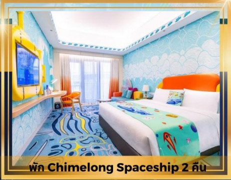
พัก Chimelong Spaceship 2 คืน