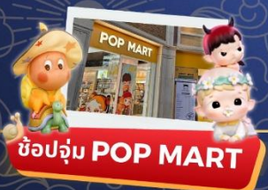
ช้อปปิ้ง POP MART