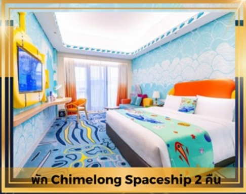
พัก Chimelong Spaceship 2 คืน