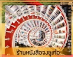
ร้านหนึ่งสี่องซูเก๋อ