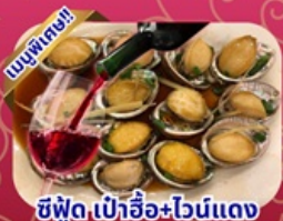
ซีฟู้ด เป้าฮ้อ+ไวน์แดง