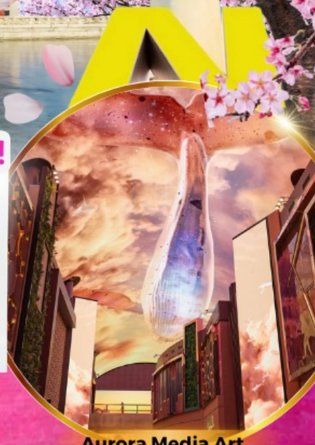
Aurora Media Art

อิสระทำสวยกับคุณหมอชื่อดังย่านคังนัม เดินทาง เมษายน-พฤษภาคม 69