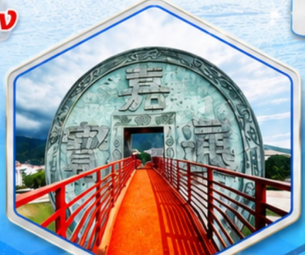
จตุรัสเหรียญโบราณ