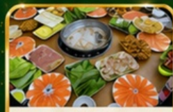
ชาชูแชลมอน