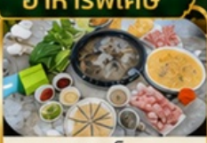
ชาชูเห็ด