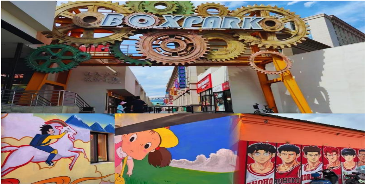
อิสระอาหารค่ำตามอรัยาศัย

จากนั้นนำท่านเดินทางไปยังถนนคนเดินคังปาสือ (Kangbashi Walking Street) ถนนสายวัฒนธรรมผสมผสานมนต์เสน่ห์ของวัฒนธรรมมองโก บริเวณรอบ ๆ มีอาคารบ้านเรือน สถาปัตยกรรมสมัยราชวงศ์หมิงและชิง เป็นศูนย์รวมของความบันเทิง ร้านค้าและร้านอาหาร แหล่งรวมอาหารหลากหลายประเภท อาหารพื้นเมืองมองโก เนื้อแกะย่าง, ซีสมม, อาหารเสฉวน, อาหารหูหนาน ฯลฯ