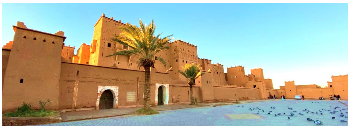
พักผ่อนค้างคืนในเมืองวอซาเซท Oscar Hotel 4* , Ourrzazate หรือเทียบเท่า

7) วันที่เจ็ด วอซาเซท - ไอท์ เบน ฮาดดู - มาราเกช (B,L,D)