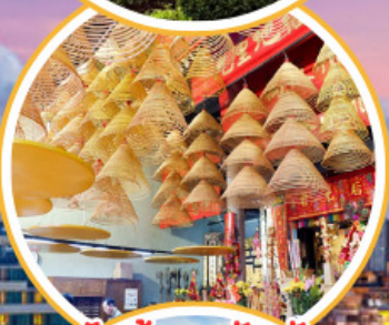
ไหว้พระวัดตั้ง