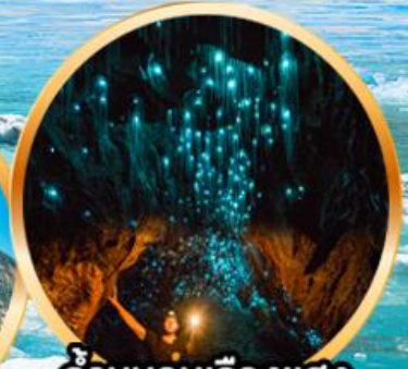
ถ้านอนเรื่องแสง ไวท์ไม

10 D | 22-31 ก.ค. 69 (วันเฉลิมฯ, อาสาพหุชา, เข้าพรรษา) 8 N | 08-17 ส.ค. 69 (วันแม่แห่งชาติ)