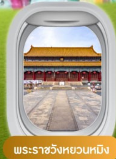
พระราชวังหยวนหมิง