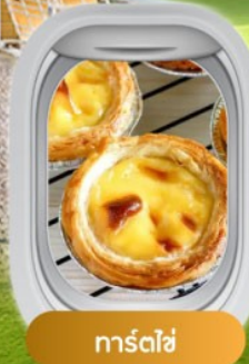
การ์ทไส่