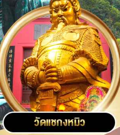
วัดเขกงหมีว