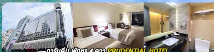
гарันตี!! พิเศษ 4 ดาว PRUDENTIAL HOTEL ติดถนนนาธาน ย่านช้อปปิ้งจิมซาจуй