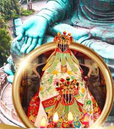
เยี่ยมเงินเจ้าแม่กวนอิมสองฮา