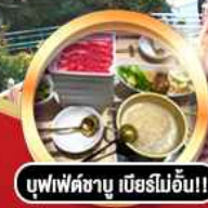
บุฟเฟ่ต์ชาบู เบียร์ไม่อั้น!!