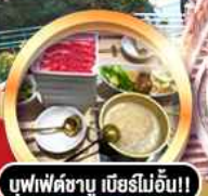
บุฟเฟ่ต์ชาบู เนิอร์ไม้อัน!!