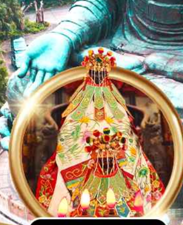
ขี้มเงินเจ้าแม่กวนอิมสองฮ่า