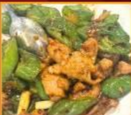
หมูผัดพริกหยวก