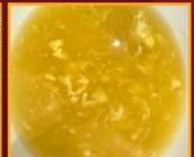
ซูปข้าวโพด