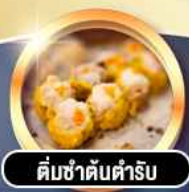
ติ่มซำคั่นตำรับ

гаринди! พักหรู 4 ดาว THE KOWLOON HOTEL ติดถนนนาธาน ย่านช้อปปิ้งจิมซาจอย