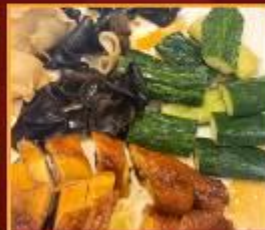
ไก่ แดงกวา เห็ดหูหนู