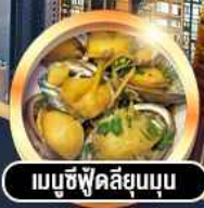
เมามูซีฟู้ดลึนบน