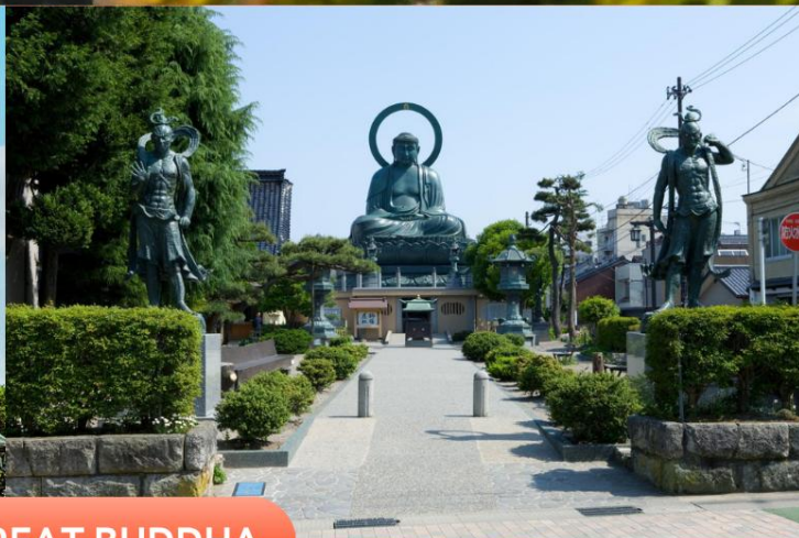
TAKAOKA GREAT BUDDHA