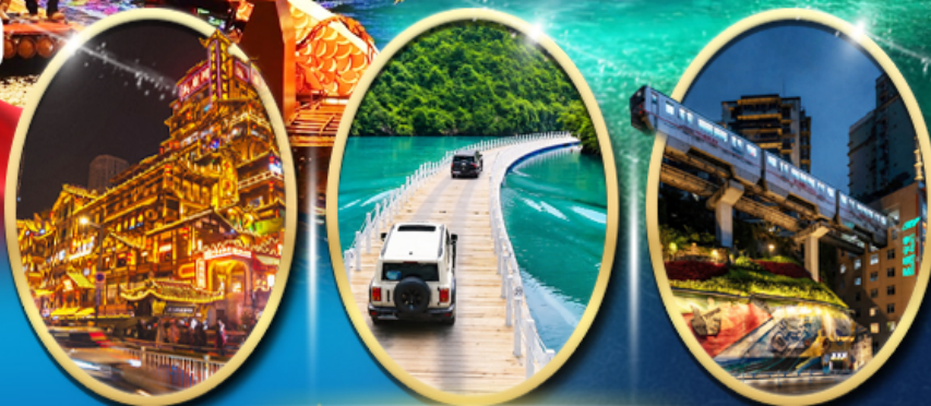
หงหยาดัง ประตูสิงโตแห่งเซวียนเอน รถไฟฟ้ายกระดับ

จัดรถเช่าเที่ยวเหมิน ดึงคอกีบ ตึก 22 ชั้น ไค่วซิงโหล