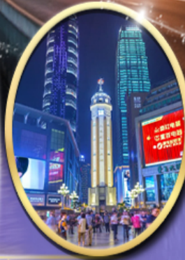
ถนนคนเดินเจียฟางเป็ย