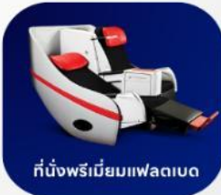
ที่นั่งพรีเมียมฟเลกซ์