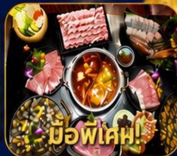
บุฟเฟ่ต์ชาบูสโด้ฮ่องกง