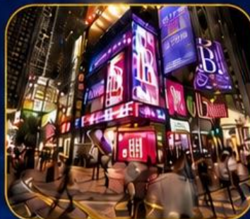
ซอปปิงชินชาฮุย