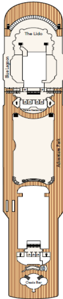
DECK 14 Hot tub, Adventure Park, Restaurants & Bar