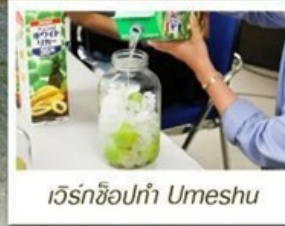
เวิร์กช็อปทำ Umeshu