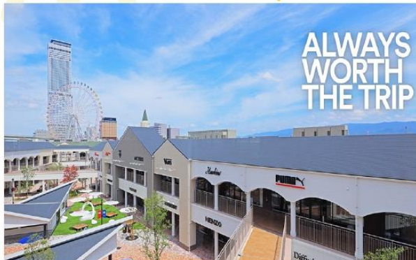
SHOPPING AT RINKU PREMIUM OUTLET