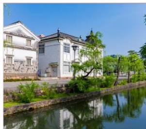
เขตอนุรักษ์เมืองเก่า คุราชิกิ