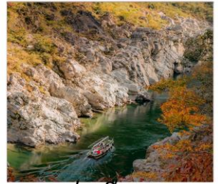
ล่องเรือชม หุบเขาโอบิโนเคะ