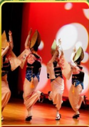
อะวะ โอะโตะริ โคคัง