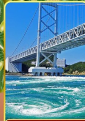
ช่องแคบนารุโตะ