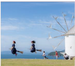
Shodoshima Olive Park เกาะมะกอก