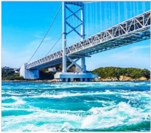
ช่องแคมนารุโตะ