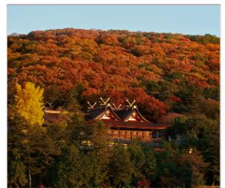
ศาลเจ้าคินิชิอิโกะ