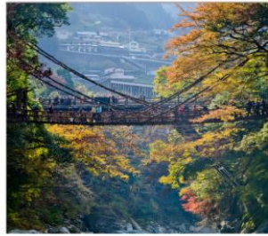
ชมสะพานคะซึระมาชิ