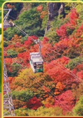
กระเช้าหุบเขาคังคาเคอิ