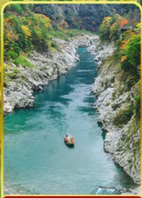
ส่องเรือช่องเขาโอโตะ