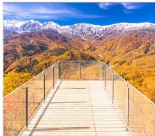
นั่งกระเช้าฮาคุมะ