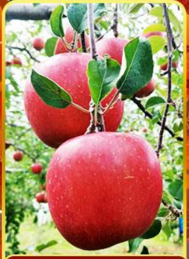
กิจกรรมเก็บแอปเปิ้ล