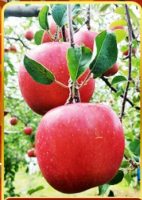
กิจกรรมเก็บแอปเปิ้ล