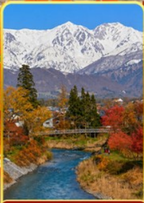
โออิเดะพาร์ค