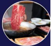
ปิ้งย่างพรีเมียม ROKKASEN เนื้อคุณภาพ