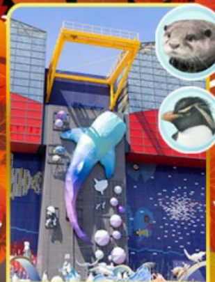
พิพิธภัณฑ์โรคคัส

ออนเซ็น 2 คั้น นน.กระเป๋า 23 กก.X2 8Days 5Night