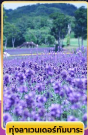
ทุ่งลาเวนเดอร์ทามบาระ