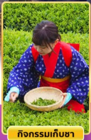
กิจกรรมเก็บชา