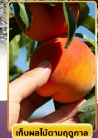
เก็บผลไม้ตามฤดูกาล

🔥 ออนเซ็น 3 คืน 🧳 นน.กระเป๋า 23 กก. ☀️ 8Days 5Night