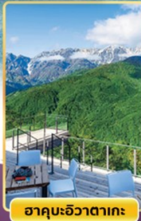
ฮาคุบะฮิวาตากะ