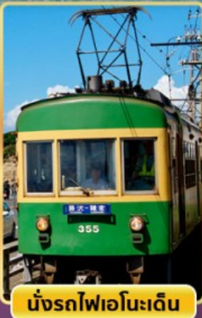
นั่งรถไฟเอโนะเด็ง