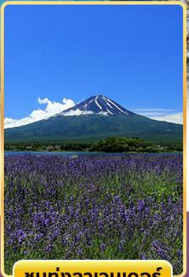
ชมทุ่งลาเวนเดอร์