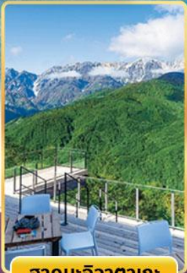
ฮาคุบะฮิวาตากะ