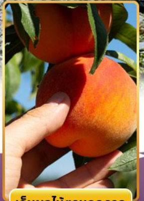
เก็บผลไม้ตามฤดูกาล

ออนเซ็น 3 คืน นน.กระเป๋า 23 กก. 8Days 5Night