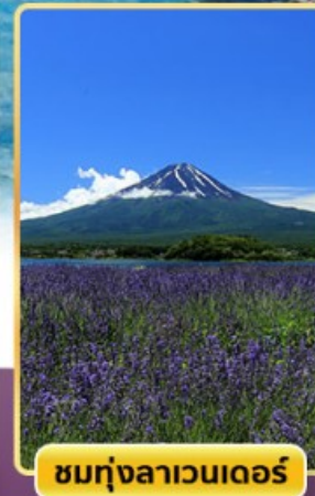
ชมทุ่งลาเวนเดอร์