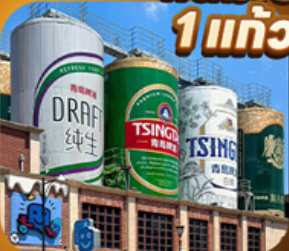
“พิพิธภัณฑ์เบียร์ซิงเต่า”

เสน่ห์เมืองชายฝั่งจินตตอนเหนือ • เวนิสตะวันออก • เก็บผลไม้ ณ สวนต้าเหลียน เมืองเหยียนโต • ท่าเรือโซ่ขาว ปลายาฟกยตัน • เมืองเฝิงไหล • แปดเซียนข้ามทะเล เมืองเว่ยไห่ • ถนนคอบเพลิงเลว 8 • ซากเรือบลูวอย • Korean Town • หมู่บ้านซาจื่อโจว สะพานจันเฉียว • โบสถ์เซนต์โมเคลิล • พิพิธภัณฑ์เบียร์ซิงเต่า • อ่าวฝูซานวาน