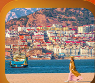
“หมู่บ้านประมงซาจื่อโจว”