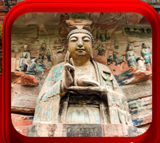
“ ผาหินแกะสลักต้าจู่ ”

บินตรงลงฉงชิ่ง • อู่หลง หลุมฟ้าสะพานสวรรค์ • ระเบียงแก๊ว • อุทยานเขานางฟ้า หงหยาดัง • นั้งรทไฟทะลุดีค • ศาลาประชาคม (ด้านนอก) • หลงหมินฮ่าว มรดกโลกผาหินแกะสลักต้าจู่ • วัดหลิวฮั่น • ตึกตะเกียบ • หมู่บ้านโบราณสี่ฮี้โจว