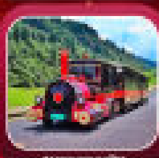
"อุทยานเทานางฟ้า"