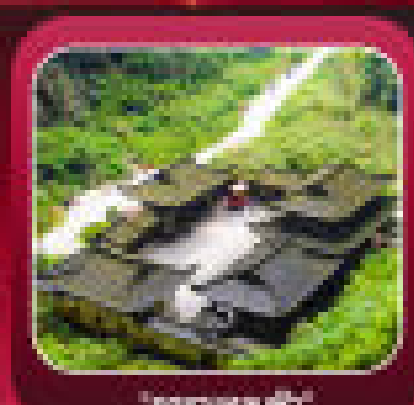
"อุทยานเทานางฟ้า"