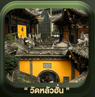
“ วัดหลัวฮั่น ”