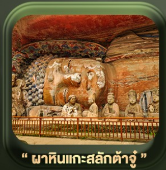
“ ฟาหินแกะสลักต้าจู้ ”