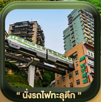
“ นั้รตไฟทะลุตัก ”