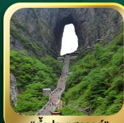
"กำแพงประตูสวรรค์"