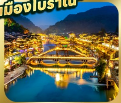
"เมืองโบราณเฟิ่งหวง"