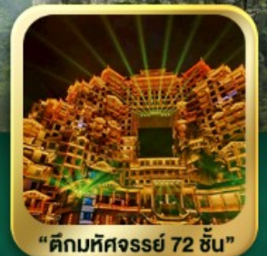
"ตึกมหัศจรรย์ 72 ชั้น"

นั่งกระเช้าชมภูเขาเทียนเหมินซาน • กำประตูล่องเรือ • ทางเดินกระจก เมืองโบราณเฟิ่งหวง • เมืองโบราณฟูหลงเจิน • ชมโซ่วจิ้งจอกขาว ภูเขาเทียนจื่อซาน (รวมลิฟต์แก้ว) • หุบเขาอวตาร • ตึกมหัศจรรย์ 72 ชั้น