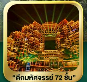
"ตึกมหัศจรรย์ 72 ชั้น"