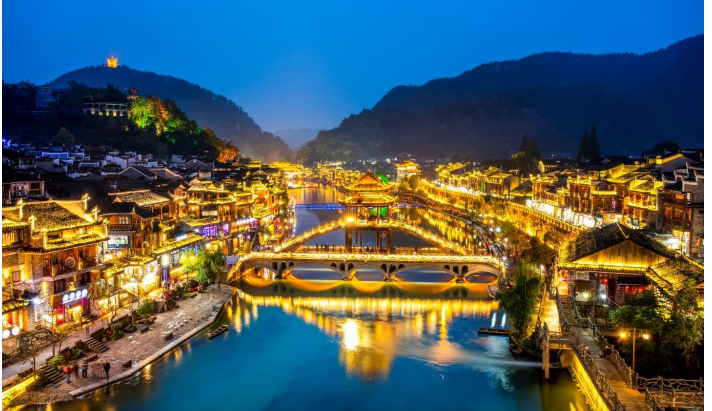
T2G-CSX15SL ฉางซา จางเจียเจี๋ย ฟุหรงเจิ้น เฟิ่งหวง สะพานแก้ว ชมโชว์นางจิ้งจอกขาว 5D 4N (SL)