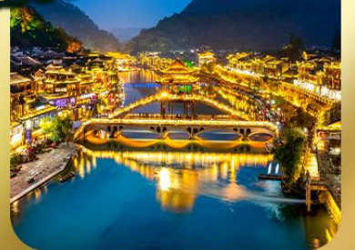
"เมืองโบราณเฟิ่งหวง"