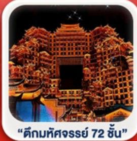
“ตึกมหัศจรรย์ 72 ชั้น”