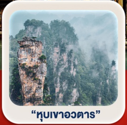
“หุบเขาอวตาร”

นั่งกระเช้าชมภูเขาเทียนเหมินซาน • กำแพงประตูสวรรค์ • ตึกมหัศจรรย์ 72 ชั้น เมืองโบราณเฟิ่งหวง (ล่องเรือ) + เมืองโบราณฟู่หลงเจิ้น **พักติดเมืองโบราณ 2 คืน** ภูเขาเทียนจื่อซาน • หุบเขาอวตาร • สะพานแก้ว+VR4D • ชมโชว์จิ้งจอกขาว