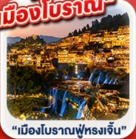
“เมืองโบราณฟู่หลงเจิ้น”