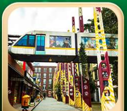
“ตงเจียวจี้”