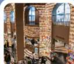
"ห้องสมุดจงซูเก๋"