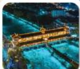
"สะพานหนานเจียว"