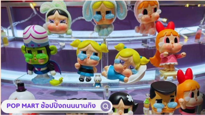
POP MART ซ้อปบั้งถนนนานกิง