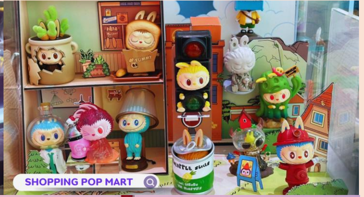
SHOPPING POP MART