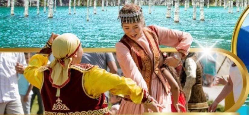
Huns Ethno Village